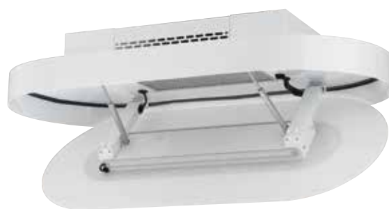
Serviceöffnung mit Liftbeschlag